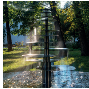
„ZIS-BRUNNEN“ Eberhard Leinhos u. a., 1967