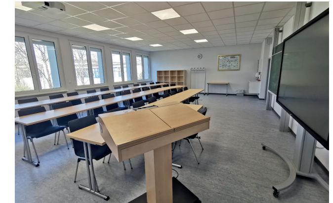
Hörsaal 6 für maximal 40 Personen

Wir verfügen über modern ausgestattete Tagungs- und Seminarräume unterschiedlicher Größe, die für Veranstaltungen, wie Tagungen, Verbands-tagungen, Seminare und Kolloquien, zur Verfügung stehen.