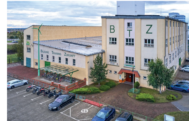
Betriebsstätte BTZ Bernburg

Das BTZ Bernburg wurde 1993 gegründet und ist ein zuverlässiger und innovativer Partner für Wirtschaft und öffentliche Träger. Seit Januar 2022 ist das BTZ eine Betriebsstätte der SLV Halle GmbH. Die Kernkompetenzen sind Verbundausbildung und vielfältige Qualifizierungen in den Bereichen der Metall- und Elektrotechnik.