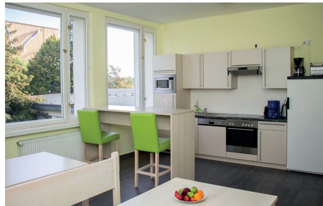
Gemeinschaftsküche im Lerninternat