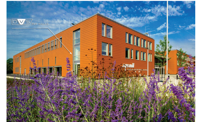
Handwerkskammer Dresden © André Wirsig

Unsere Betriebsstätte in Dresden präsentiert sich an einem neuen modernen Standort im njumii, dem Bildungszentrum des Handwerks der Handwerkskammer Dresden. Mit einem erweiterten Aus-/Weiterbildungsangebot sowie allen Dienstleistungsangeboten und dem Know-how der SLV Halle GmbH steht die Betriebsstätte Dresden ihren regionalen und überregionalen Kunden und Geschäftspartnern gern zur Verfügung.