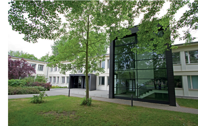
Haupteingang zum Großen Hörsaal

Der Campus der SLV Halle GmbH bietet ein ansprechendes Umfeld für seine Gäste. Ein großzügiger Empfangsbereich im unteren Foyer bietet schon bei der Tagungsanmeldung eine angenehme Atmosphäre.