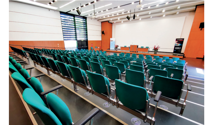
Großer Hörsaal für maximal 230 Personen

Bis zu 230 Personen finden im Großen Hörsaal Platz, der mit einer Beameranlage und High-Tech-Tonanlage ausgerüstet ist. Das obere Foyer ist für die Versorgung der Gäste während der Tagungspausen bestens ausgestattet.