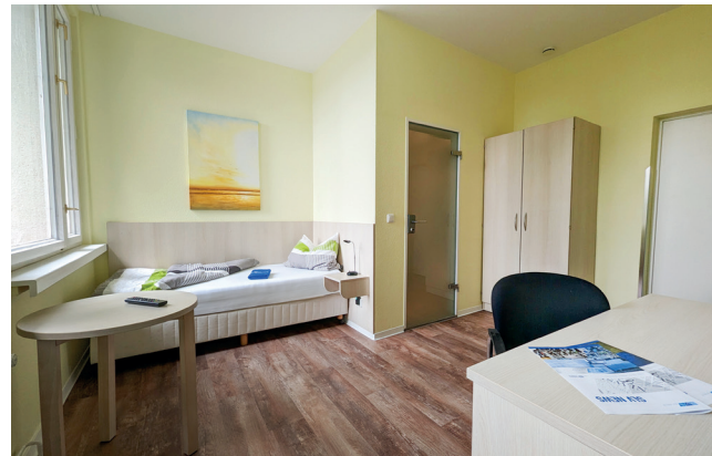
Einzelzimmer im Lerninternat